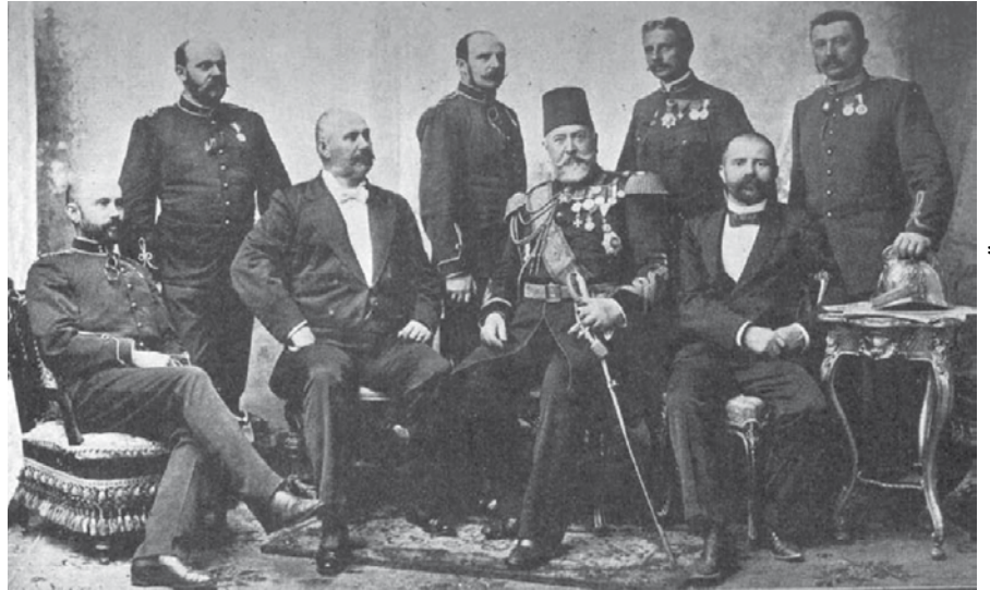
gróf Széchenyi Ödön (középen, karddal)

Az általa – a fenti szavakkal – méltatott önkéntes tűzoltóságok rendszere azonban vidéken már működött, mielőtt a budapesti tűzoltó parancsnokság megalakult volna. Sőt, a vidéki egyesületeket már egy országos szövetségbe tömörülés gondolata foglalkoztatta.