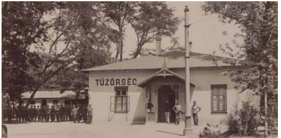
Millenniumi kiállítás: A Tűzország épülete (1896)

Levéltári jelzet: HU.BFL.XV.19.d.1.09.096