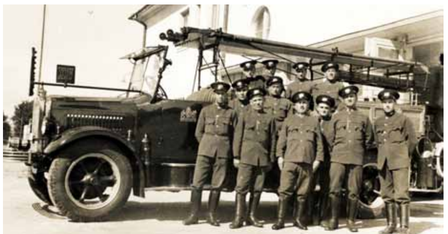
Budapest, XIV. kerületi tűzoltóság legénysége (1940 / Fortepan)

Fortepan / Budapest Főváros Levéltára. Levéltári jelzet: HU.BFL.XV.19.d.1.09.096