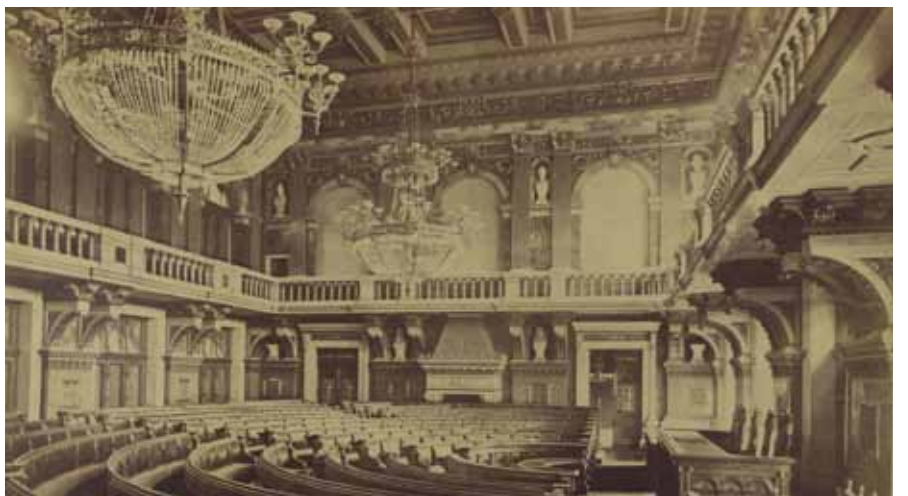
A pesti Új Városháza ülésterme (1870-es évek) Levéltári jelzet: HU.BFL.XV.19.d.1.05.039