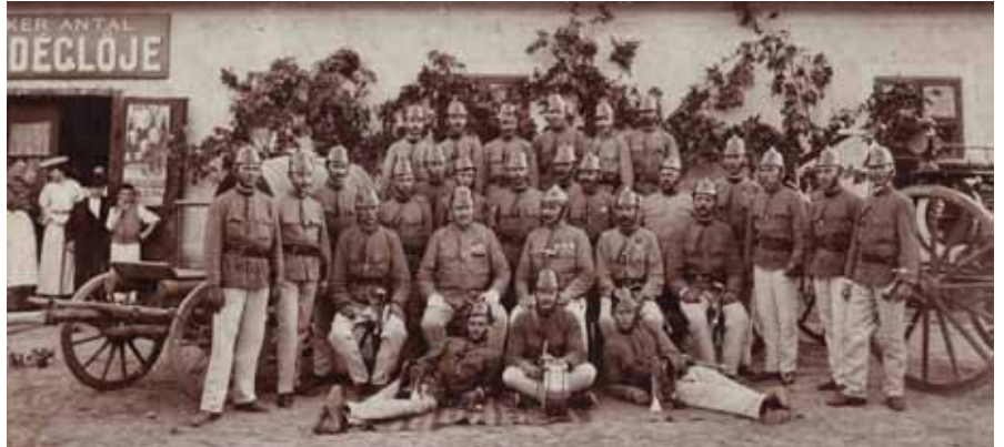
Tűzoltó csoportkép (1908 / Fortepan)

A Magyar Országos Tűzoltó Szövetséget végül (ideiglenesen ugyan, de hosszú időre) a történelem vihara sodorta el: az Ideiglenes Kormány 1945-ben megszüntette a szervezetet.