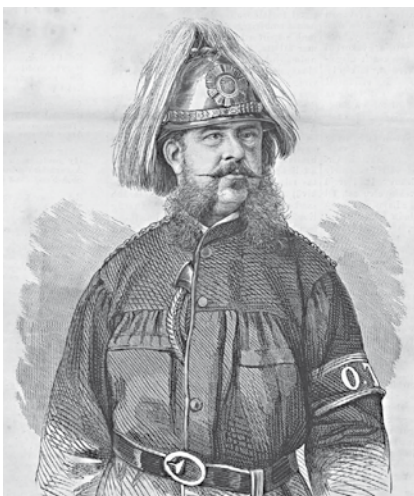
Gróf Széchenyi Ödön